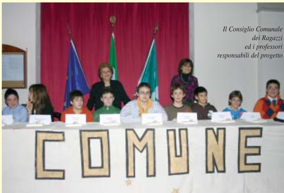
Il Consiglio Comunale dei Ragazzi ed i professori responsabili del progetto

Di fronte ad una platea gremita gli intervenuti hanno voluto congratularsi e augurare buona fortuna all'amministrazione junior appena