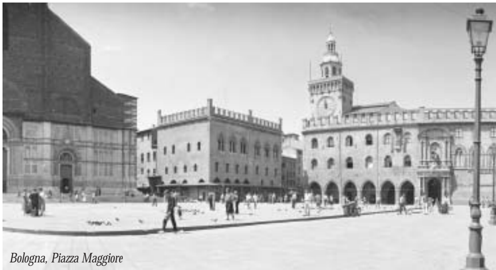
Bologna, Piazza Maggiore